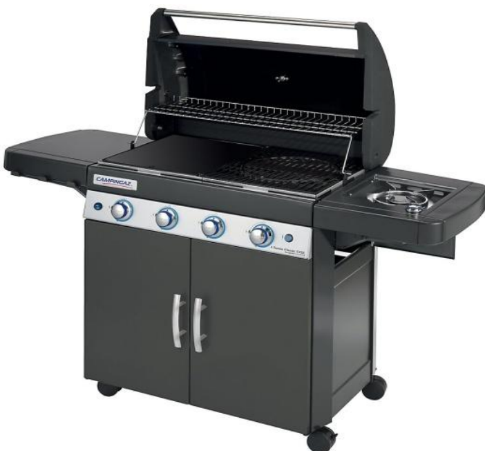
4 SERIES CLASSIC EXSE