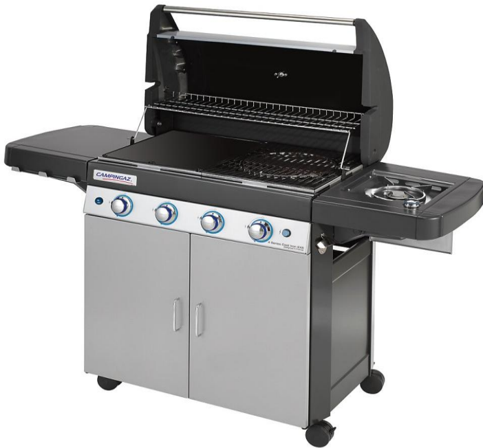
4 SERIES CAST IRON EXS